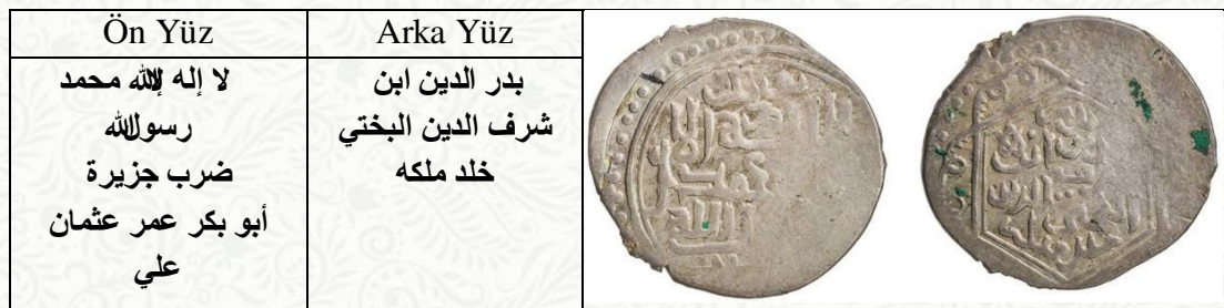
Bedreddîn bin Şerefeddîn tarafından Cezîre'de basılmış gümüş dirhemler 7

oraya sığındı. Fakat Akkoyunlular orayı da kuşattılar. Bedro Bey kaleden inerek burayı onlara teslim etti. Akkoyunlular önce Bedro Bey'in oğlu Hasan'ı sonra da Bedro Bey'i öldürdü ve Cezîre'ye egemen oldu (Ebubekir-i Tihranî, 2014:353-354; el-Malatî, 2011: I/647).