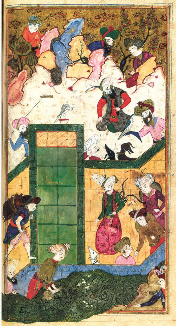
Şeref Xân-ı Bidlîsî'nin Şerefnâme isimli eserinde Cezîre Buhtan'ı gösteren bir minyatür (Bidlîsî, Şerefnâme ) 3

arasında yaşamaya başladı. Kendisini ibadete ve ölünceye kadar böyle yaşadı (Yezdî, 1887: I/671-676; Bidlîsî, 1860: I/120-122). Emir İzzeddin Ahmed siyasetten uzak durunca kardeşi Meceddin onun yerine aşiretin yöneticiliğini yapmaya başladı. Nitekim 1420 yılında Akkoyunlu hükümdarı Kara Yülük Osman ile sorun yaşayan Karakoyunlu İskender düşmanına karşı Cizre emiri Meceddin'den yardım istedi. Meceddin onun bu çağrısına olumlu yanıt verdi ve yanına aldığı 3000 kişilik orduyla İskender'in ordusuna katıldı (Ebubekir-i Tihranî, 2014:61).