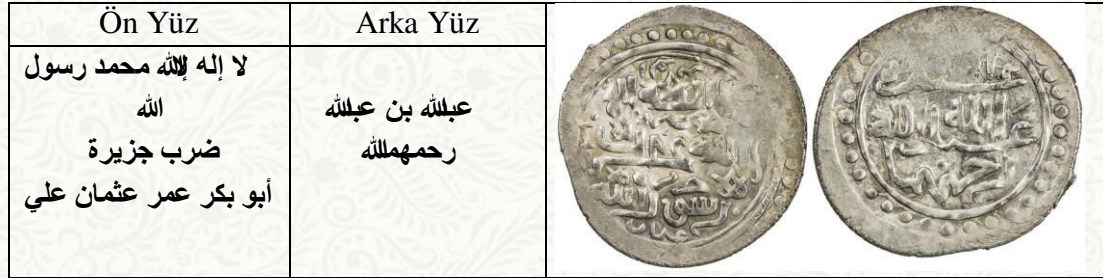
Abdullah bin Abdullah tarafından Cezîre'de basılmış gümüş dirhem 5

edince yerine Abdal Bey diye tanınan Zeyneddîn lakaplı Abdullah bin Abdullah geçti (Xanî, 1337/1919: 22). 4 Abdal Bey ilk sikke bastıran Cezîre yöneticisidir (Ilich, 1978:1-5).