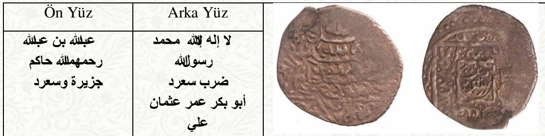
Abdullah bin Abdullah tarafından Siirt'te basılmış gümüş dirhem (Stephen Album Koleksiyonu). 6

1458 yılında Mîr Abdal vefat edince yerine oğlu İbrâhîm Cezîre'de Buxtî beyliğinin yönetimine geçti. Mîr İbrâhîm kısa bir süre Cezîre tahtında kaldıktan sonra 1459 yılında yönetimi bırakmak zorunda kaldı (Adday, 2015:39).