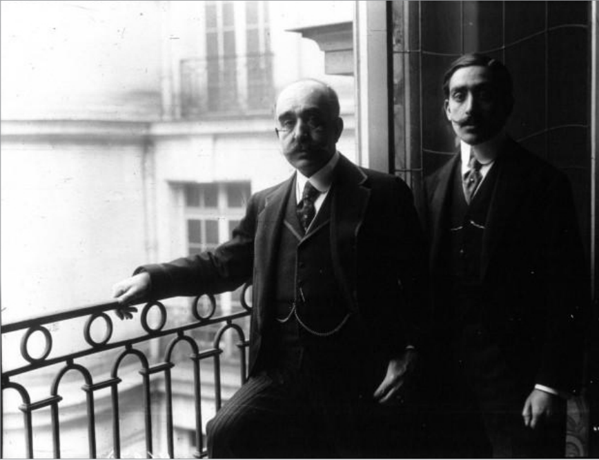
Şerif Paşa, damadı Salih Bey ile birlikte suikasta uğradığı Rue de la Pompe'taki adresinde.

Şerif Paşa'nın damadı Mehmet Salih Bey'in katili evin içinde öldürmesiyle engellendi. 21