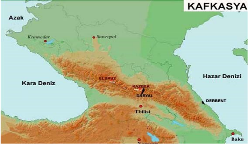
Harita 1: Kafkasya, http://www.haberhit.net/haber-13999-Kafkasya-Neresidir.html 12 Nisan 2012