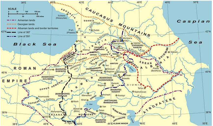
Harita 2: Kafkasya

http://en.wikipedia.org/wiki/File:Ancient_countries_of_Transcaucasia.jpg 30 Eylöl 2011