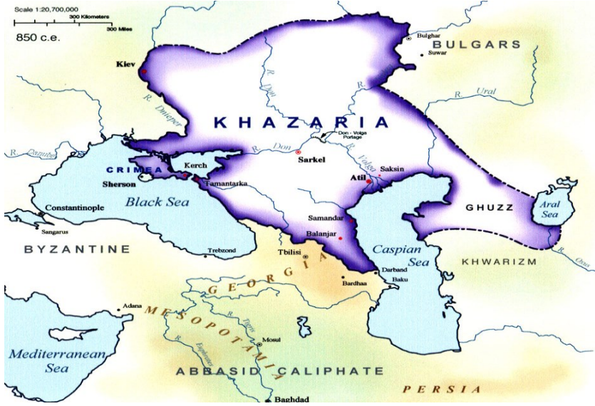
Harita 9: Kaynak:

http://www.bibliotecapleyades.net/imagenes_sociopol/khazar03_01.jpg 30.09.2011