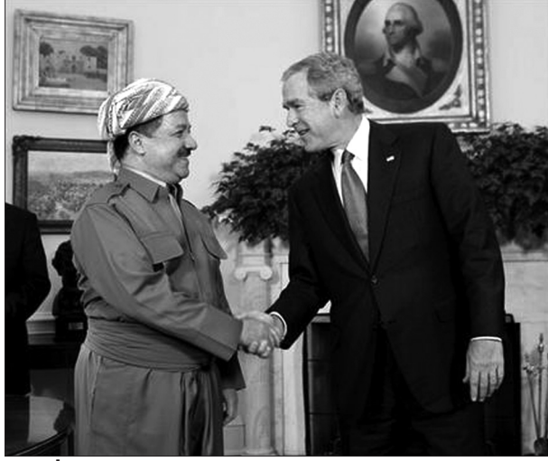
İki dostun Beyaz Saray'da el sıkışması.