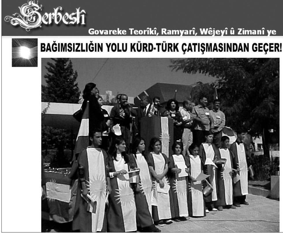
Barzani'yi destekleyen Serbesti Dergisi'nin internet sitesinden bir görüntü.

durum değerlendirmesi yapmıştır. 70 Halidiye Nakşibendiliği'nin temsilcileri benzer şekilde bir araya gelerek irtibatlarını sürekli devam ettirmişlerdir.