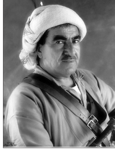
Molla Mustafa Barzani

diler. Ahmet Barzani de Molla Mustafa Barzani önderliğinde 500 kişiyi Oramar (Hakkari) yöresine göndererek buralarda karışıklıklar çıkarılmasını sağladı. 9 Türk askerinin gücünün zayıflatılmasını sağlamak amaçlı bu harekâta nispeten başarılı olunmuş, Türk askerinin bu bölgeye kuvvet kaydırılması sağlanarak Ağrı İsyanı'nın uzamasına vesile olunmuştur. Barzani'nin Türkiye'yi arkadan vurma faaliyetlerine rağmen 1932-33'de Türkiye'ye sığındığı zaman 11 ay ülkemizde kalmasına izin verilmiştir.